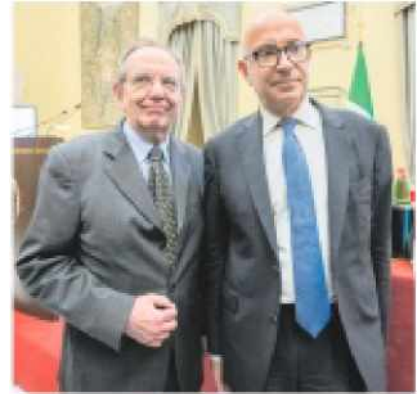
COMMISSARIO Pier Carlo Padoan (a sinistra) con Yoram Gutgeld (Pd)