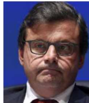
Il ministro Carlo Calenda

Ma, calca la mano Calenda, è lo stesso Pd, che ha messo la firma sul disegno di legge e ha voluto quei contenuti, che «non può permettersi di non chiudere». Il Paese, aggiunge, «si è impegnato a fare una legge annuale e non riesce ad approvare una legge che sta diventando quinquennale. Dobbiamo chiudere e portarla a casa, spero la prossima settimana». Calenda non rinuncia però nemmeno a ribadire la sua preferenza per incentivi mirati e automatici come super e iperammortamento, che si valuterà solo in autunno se prorogare, e per un taglio del costo del lavoro.