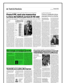
Superficie 8 %

ARTICOLO NON CEDIBILE AD ALTRI AD USO ESCLUSIVO DEL CLIENTE CHE LO RICEVE - 1948