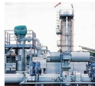
Pesano i costi di gas ed energia

I tre consorzi per l'acquisto di energia di Confartigianato «nel 2022 hanno favorito l'acquisto di elettricità e gas al miglior prezzo sul mercato per 49.627 tra imprese e famiglie, distribuiti in 88mila punti di fornitura. Il totale dei consumi di energia gestiti dai consorzi ammonta a 893,7 milioni di kwh mentre per il gas metano si attesta a 69,6 milioni di metri cubi. Clienti e volumi sono in costante crescita».