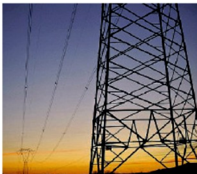
Pmi, crescono i costi delle bollette

Il report di Confartigianato esamina l'impatto del costo delle bollette sulle Pmi ma si sofferma anche sulla reazione delle aziende: «Strategie diverse: spicca la riduzione dei margini di profitto (nel 47,8% delle imprese) accompagnata dalla ricerca di nuove forme di approvvigionamento energetico green. Il 22,2% delle piccole imprese manifatturiere ha rinegoziato i contratti o cambiato il fornitore (i37,9% per le imprese dei servizi), il 13,2% ha puntato su maggiore efficienza energetica degli impianti e il 17,1% sul consumo di elettricità auto-