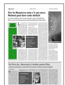
Superficie 6 %

ARTICOLO NON CEDIBILE AD ALTRI AD USO ESCLUSIVO DEL CLIENTE CHE LO RICEVE - 1948 - L.1721 - T.1721